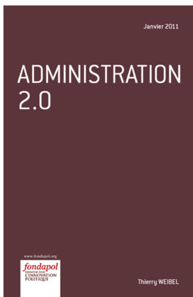
Administration 2.0 Thierry Weibel, janvier 2011, 48 pages