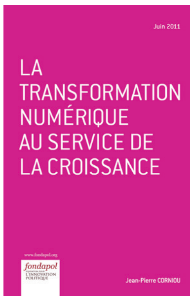
La transformation numérique au service de la croissance Jean-Pierre Corniou, juin 2011, 52 pages