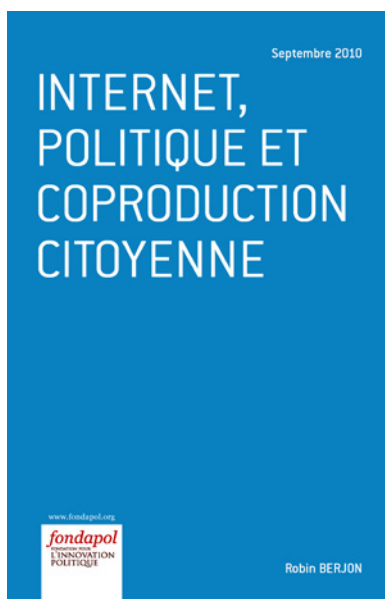
Internet, politique et coproduction citoyenne Robin Berjon, septembre 2010, 32 pages