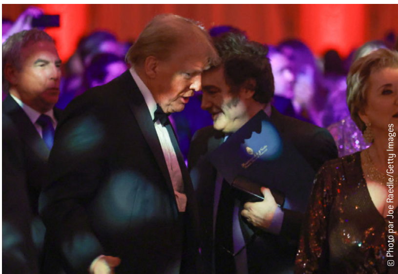
Javier Milei passe devant Donald Trump au gala de l' America First Police Institute , le 14 novembre 2024 à Palm Beach, Floride.